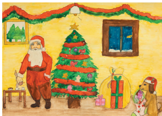
Noa de Sousa (10 anys).