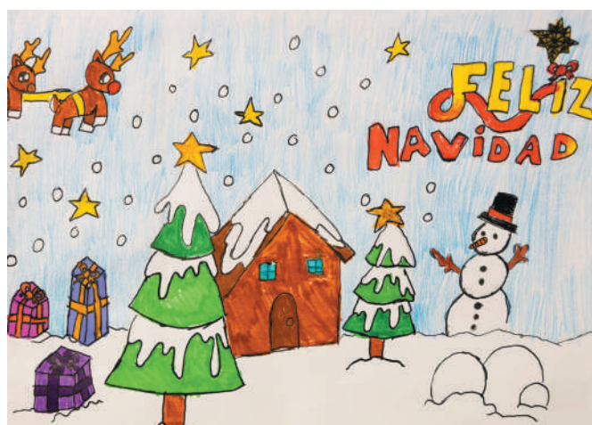
Sergi Fenollar (9 anys).