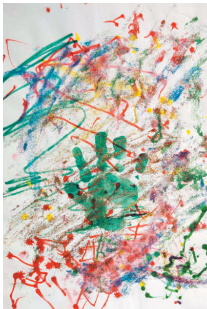
Neus Ramis (2 anys).