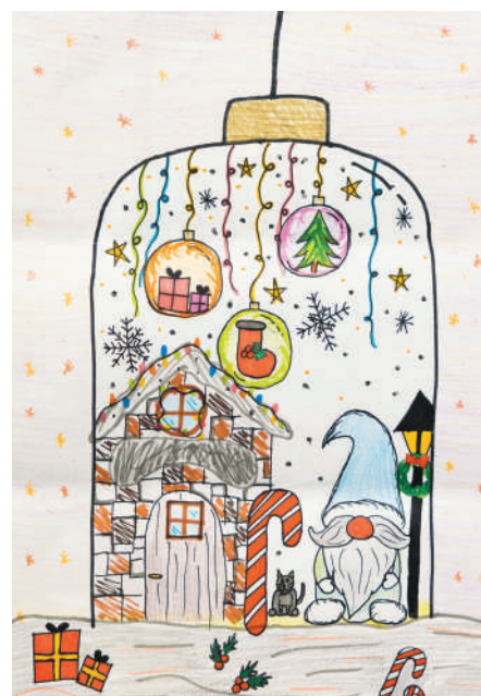
Paula Gramalles (14 anys).