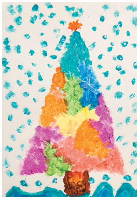
Elioenai de Sousa (5 anys).