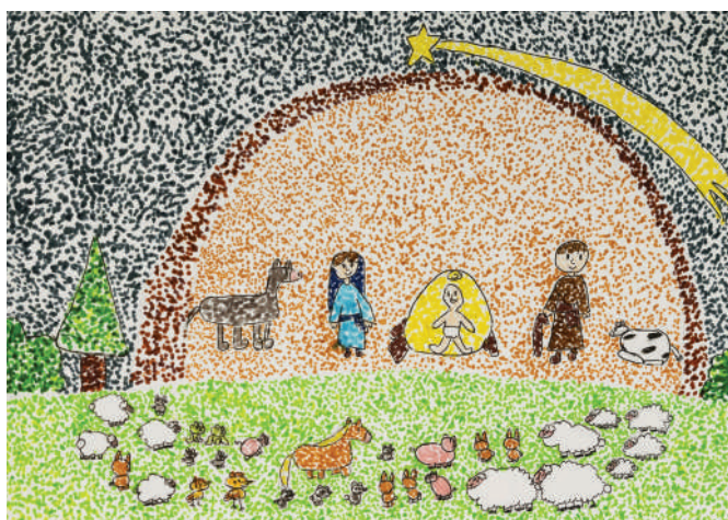
Esther Oliva (10 anys). dibuix que es convertí en felicitació.